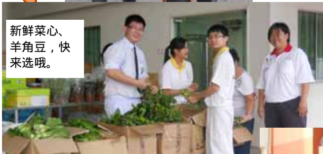
新鲜菜心、羊角豆，快来选哦。