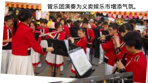
管乐团演奏为义卖娱乐市增添气氛。