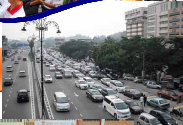
上图：车龙排至高架桥上。