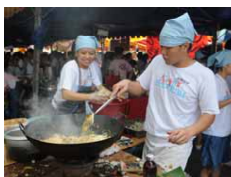
从搬水到准备食物到现炒现卖，同学们都亲力亲为。