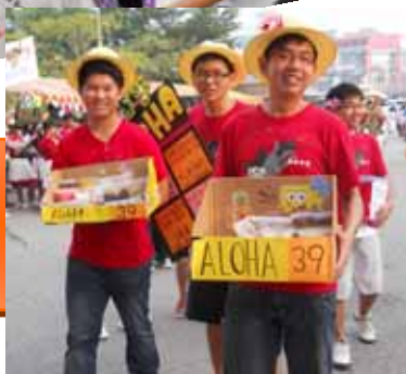
右图：同学们充当移动广告，图出奇制胜。