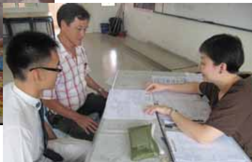
右图：班导师与家长针对子女在校表现进行交流。