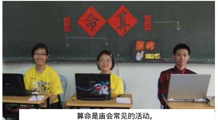
算命是庙会常见的活动。