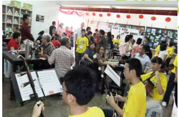
来到庙会的来宾，坐着品茶，吃着美食，听着华乐。