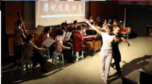
华乐团与舞蹈社携手于文艺小舞台演出《梁祝》。