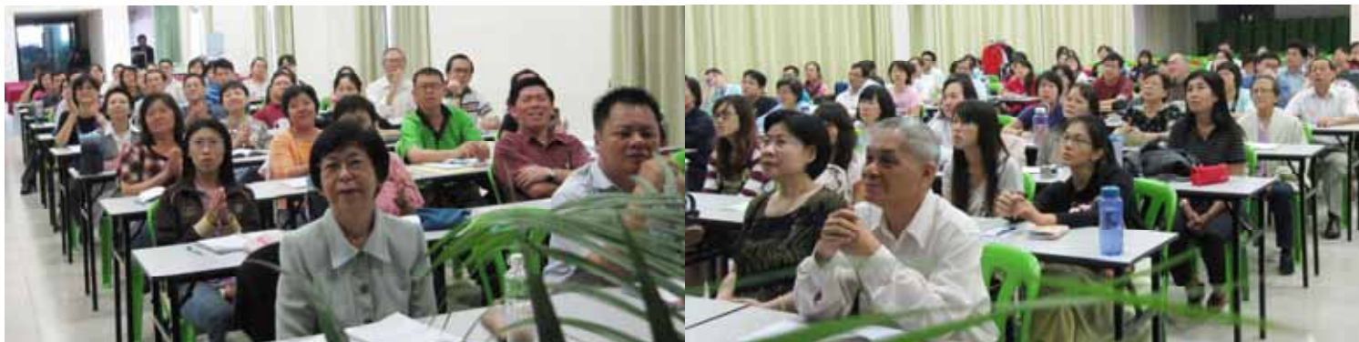
全体教师出席教育研讨会，对教育工作及发展进行研讨与总结。