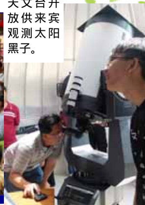
天文台开放供来宾观测太阳黑子。