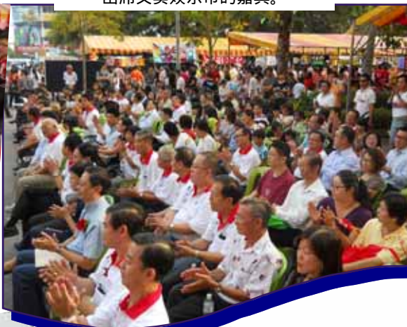
出席义卖娱乐市的嘉宾。