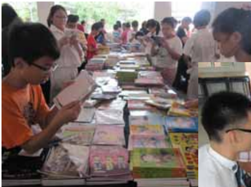
左图：书展方便师生、家长购书。

此外，我校也在仁爱广场拍卖619义卖娱乐市剩余物品，各式各样的物品都受到了家长们的热烈响应采购。