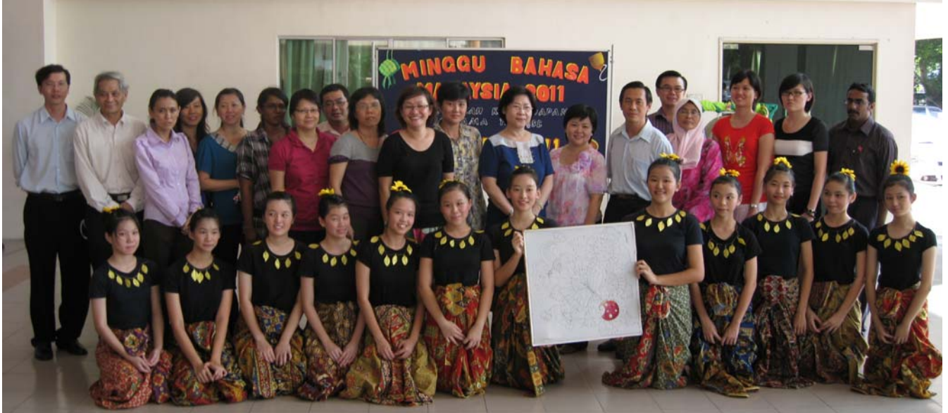
■ 國語周開幕儀式上行政主任、全體國文老師和舞蹈社社員手持峇迪布畫合影。