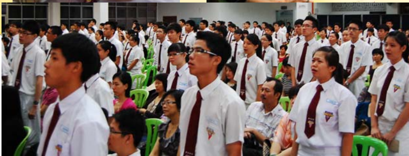
同学们在献唱成年礼歌曲时，有感于父母师长的恩情，潸然落泪。