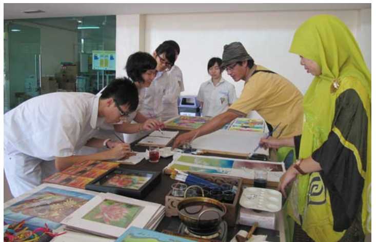
■ 同学们在专人指导下体验峇迪的制作过程。

每一次举办国语周都有明确的目标，这次也不例外。今年的国语周，主要希望同学们通过各种马来传统艺术与文化，对友族文化有更深刻的认识，在提升国语的水准同时，也了解友族同胞的生活乐趣。国语周得以圆满落幕，有赖工作同仁们的共同努力，因为从筹备活动的系列准备工作、相关联络和申请程序、到活动结束后的检讨会议，大家都全程投入。另外，由学校特邀来自kompleks kraf kuala lumpur 手工艺品中心的峇迪师傅前来示范制作峇迪的过程，让大家近距离欣赏这门艺术的特色，相信让大家对本土手工艺有更多的了解。在仁爱广场为大家示范陀螺玩法的师傅，则是盛邀来自kelab gasing 陀螺学会的会员们为大家示范正确玩陀螺的方式。“Congkak”等马来传统游戏则主要由国文学会的同学负责引导大家参与其中。我们都共同希望透过国语周，除了推广学习国语的重要性外，也能鼓励同学们学习欣赏和尊重马来传统文化，以期大家不分你我共同为打造和谐的马来西亚而努力。