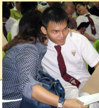
父母看到孩子亲笔写的家书，欣慰孩子已长大。