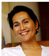
已故导演 Yasmin Ahmad。

编者按：如果你对国庆日的国油电视广告如《little indian boy》、《Gossip》、《Tan Hong Ming in love》和《Race》等有印象，相信都被其中打破种族隔阂的内容所打动。这几支广告正是由我国已故女导演 Yasmin Ahmad (1958-2009) 所执导。不管是广告还是电影，Yasmin Ahmad都以多种语言及细腻的笔触，跨越单一文化界限，以各族文化交融为题材，传达和平及种族和谐的讯息。她的电影作品包括：《爱到眼茫茫》(Rabun)、《我爱单眼皮》(Sepet)、《花开总有时》(Gubra)、《木星的初恋》(Mukhsin)、《皈依》(Muallaf) 和《恋恋茉莉香》(Talentime)。