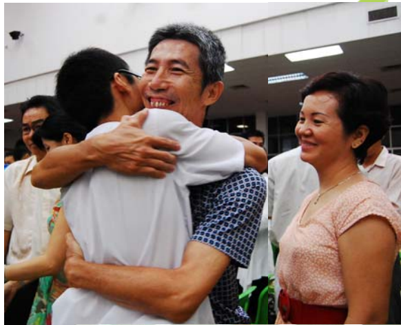
孩子给父母一个深的拥抱，表达感谢父母的养育之恩。