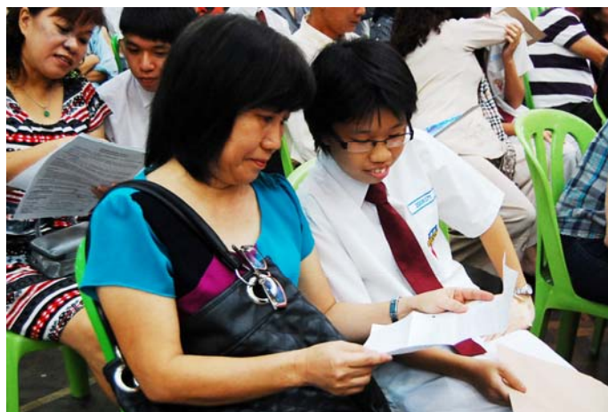
■ 父母读着孩子的家书，亲子真情互动。