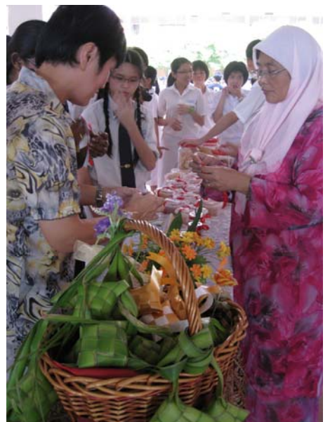
■ 老師與同學們品嚐馬來糕點和學習編織ketupat糕點袋子。

各式各樣的馬來傳統遊戲和品嚐馬來糕點，其中包括學習編織ketupat糕點袋子，玩batu seremban五粒子遊戲、congkak遊戲、teng-teng跳格子遊戲和dam棋子遊戲等，讓大家在飽眼福之餘也體驗馬來傳統遊戲的樂趣。除此之外，主辦單位深諳欣賞本土製作的馬來電影也是探究馬來文化的方法之一，為此還另辟播放馬來影片的区域，讓大家欣賞已故導演Yasmin Ahmad 的電影作品。各種精心籌備的活動，主要是希望讓全體師生能夠通過國語周