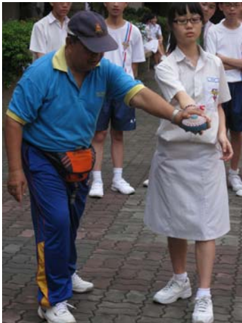
■ 上图: 同学们在玩batu seremban游戏。右图: 玩陀螺