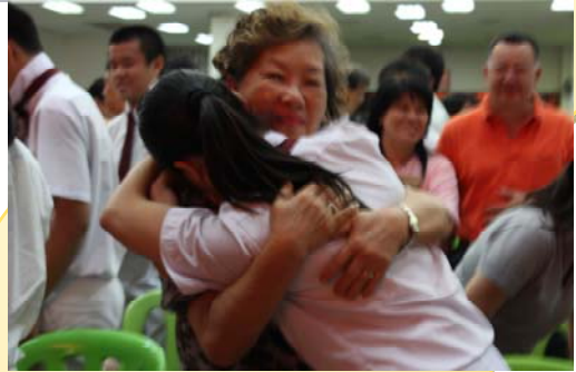
下图：父母阅读着孩子写给自己的心声。