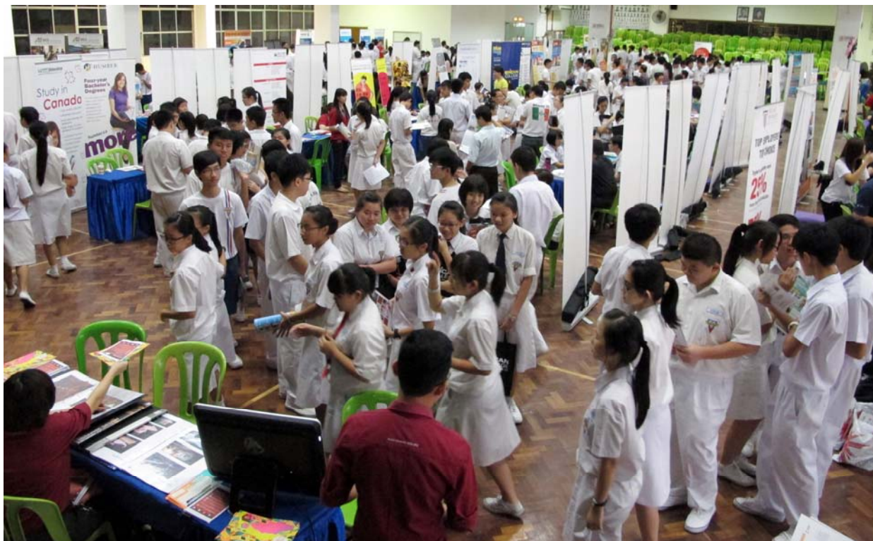
■ 前来参展的教育单位超过40所，同学们把握机会询问升学概况。