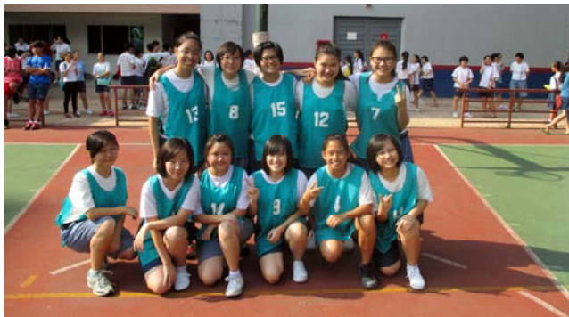
■ 女乙组冠军: 高一文商义