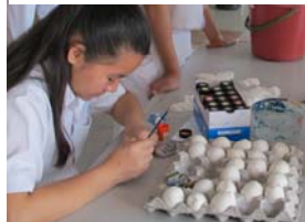
上图：美术学会举办彩绘活动。