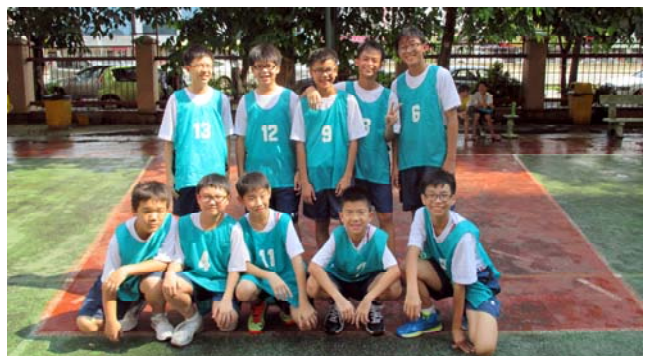
■ 男丙组冠军：初一智