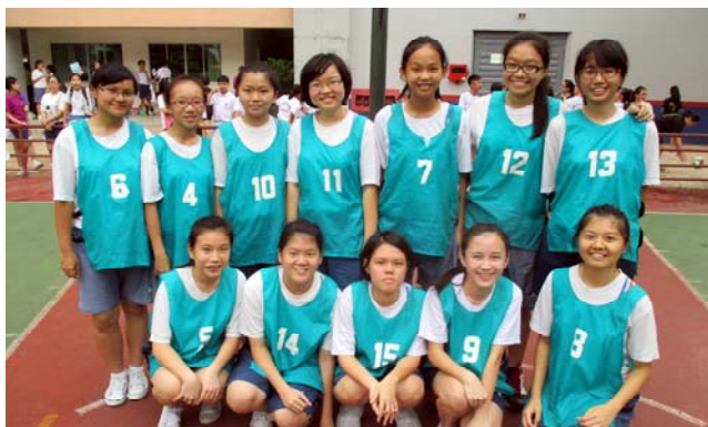
■ 女甲组冠军: 高二文商爱