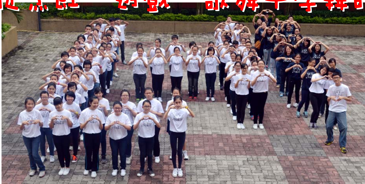
■ 我们开开心心一起来学韩语。