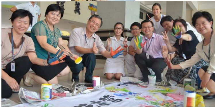
师长与同学们通过即兴的行为艺术，展现出艺术营的主题“艺瞬间”的精神。