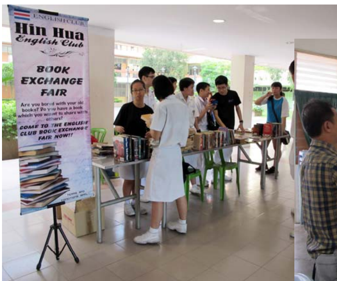
■ 好书等待有缘人带回家。