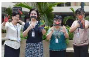
上图：摄影学会举办创意摄影活动。