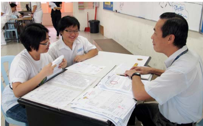
■ 班導師與家長針對孩子的學習狀況及身心發展進行交流。