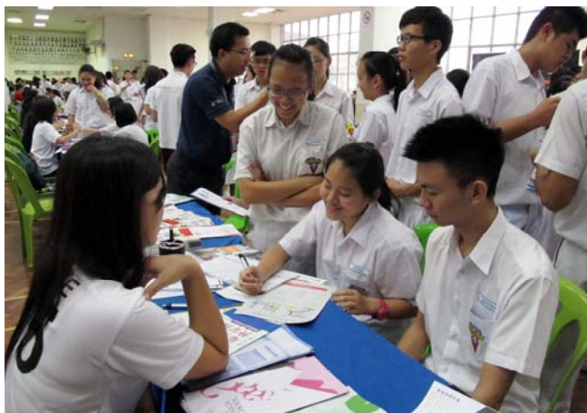
■ 同学把握机会纷纷向有关的参展单位了解升学详情。

独中生升学道路宽广，但理性地选择大学和专业却是人生道路上重要的一环，通过此次的教育展，同学们可从中沉淀自己，省思自己的兴趣与不足，再重新装备自己，俾在毕业后升学与就业的交叉路上做出明智的判断。