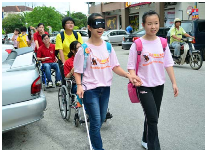
在户外实地体验残障人士在生活中所面临的困难。

通过这两天的体验活动，同学们除了从义工们身上学习到如何用正确的方法帮助残障人士之外，也学习到如何以正确的心态看待残障人士，“阳光天使”的爱心已悄悄在心中滋长。