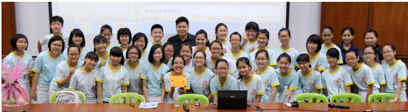
出席讲座的部分同学于讲座结束后与陈嘉荣主播（后排中）开心合照。