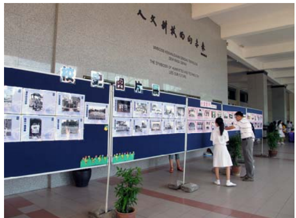
■ 校史展让大家更了解兴华。

在仁爱广场也看到我校67年来建校过程的校史图片展，通过一张张泛黄而珍贵的老照片，让历史重现，让彼此亲近，感受前人的毅力与精神。