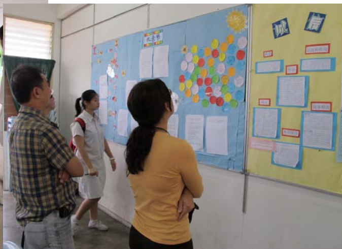
■ 家长们观看班级壁报。有的班级以双亲节为主题,把满满对父母的感激贴满壁报。