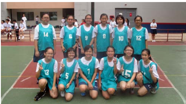
■ 女丙组冠军：初二礼