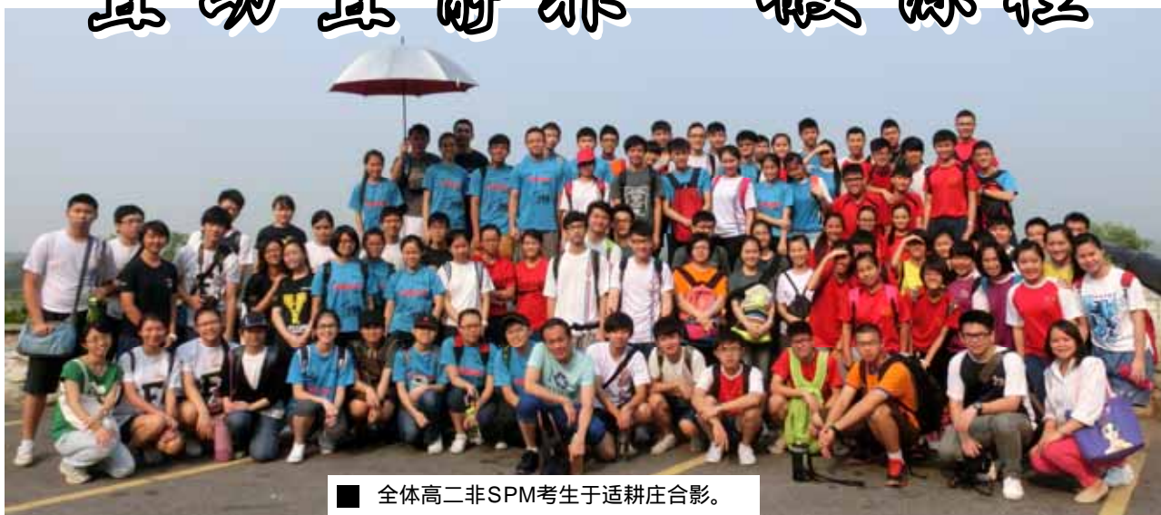
■ 全体高二非SPM考生于适耕庄合影。