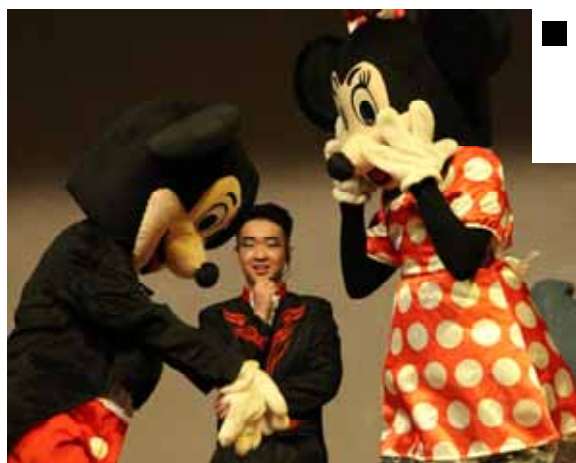
■ 卡通人物也来凑热闹。

一连串精彩的表演后，压轴的“海盗与魔术师”剧场又将观众带向另一波高潮。除了有不同角色的人物穿插其中，更有多色变化灯光效果和夸张的舞蹈动作，使魔术表演变得生动有趣。海盗剧高潮的一幕是当海盗把魔术师锁进箱子后，围着箱子的黑布缓缓升起一定的高度，当黑布迅速落下的一刹那，魔术师已然突破重重的锁，站在箱子上。魔术表演在海盗对魔术师无计可施的无奈下画上句点。