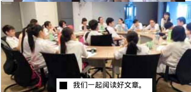
我们一起阅读好文章。