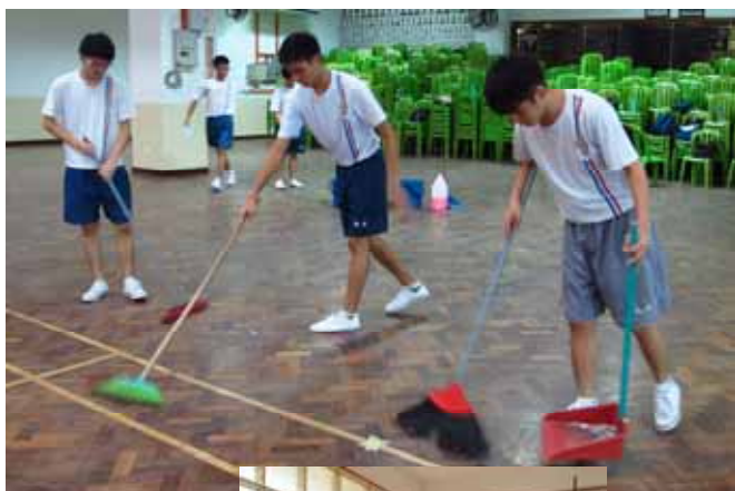
■ 上图：同学们于公共区域打扫。

在同学们干劲十足，群策群力之下，校园顿时焕然一新，同时也营造了更舒适、卫生的校园环境。