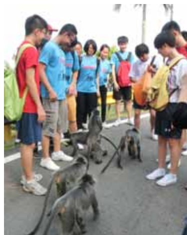
■ 皇家山古迹甚多，猴子也多。

户外活动则有适耕庄鱼米之乡一日游，让一些在城市生活长大的孩子可以真正地了解和亲身体验“农村生活”，了解稻米从播种到包装的全部过程。同时，也前往皇家山与一群“猴子猴孙”同乐，享受与大自然的融合和交流。