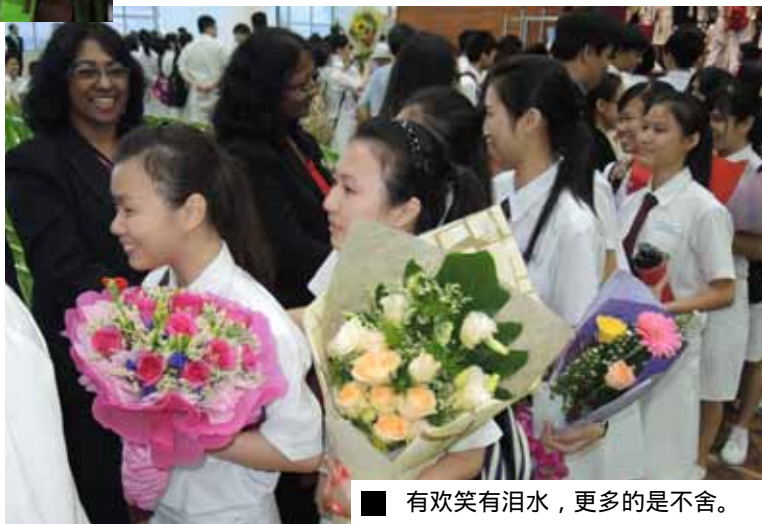
■ 有欢笑有泪水，更多的是不舍。