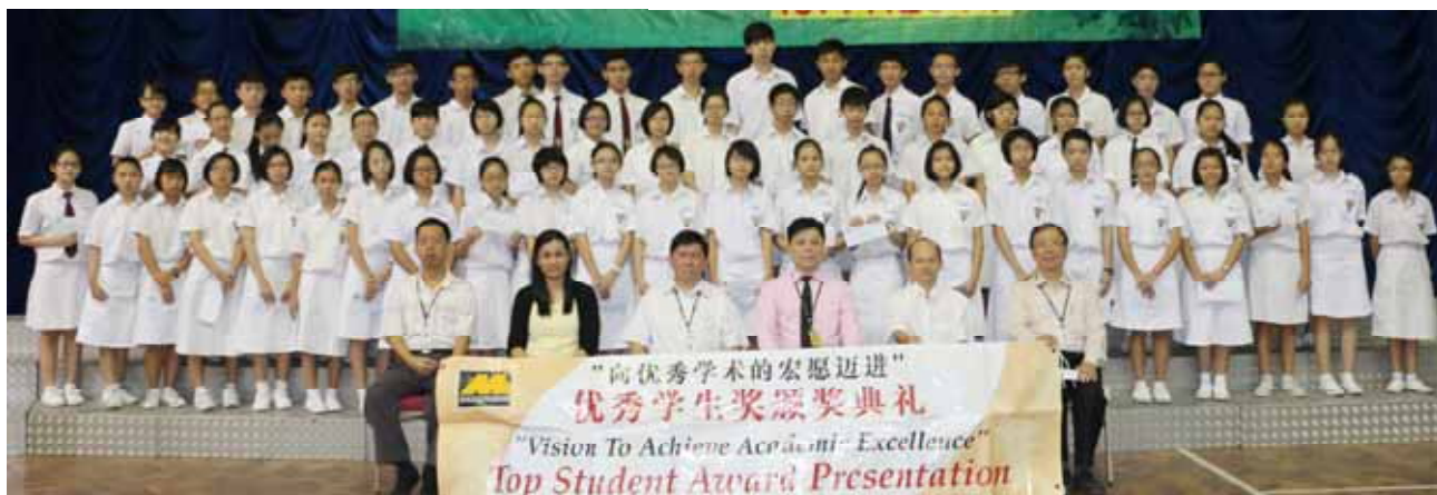
■ 获学术优秀奖、最佳学术跃进奖和全能表现奖的同学与师长们合影。