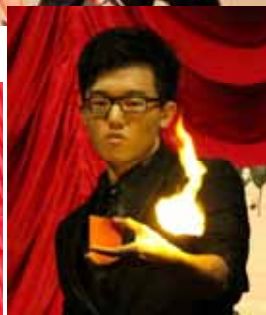
■ 突现突隐的火苗让人摸不着头脑。

一连串精彩的表演后，压轴的“海盗与魔术师”剧场又将观众带向另一波高潮。除了有不同角色的人物穿插其中，更有多色变化灯光效果和夸张的舞蹈动作，使魔术表演变得生动有趣。海盗剧高潮的一幕是当海盗把魔术师锁进箱子后，围着箱子的黑布缓缓升起一定的高度，当黑布迅速落下的一刹那，魔术师已然突破重重的锁，站在箱子上。魔术表演在海盗对魔术师无计可施的无奈下画上句点。