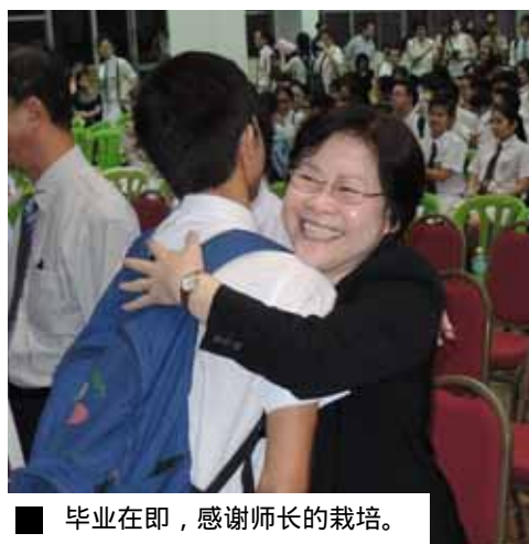
■ 毕业在即，感谢师长的栽培。