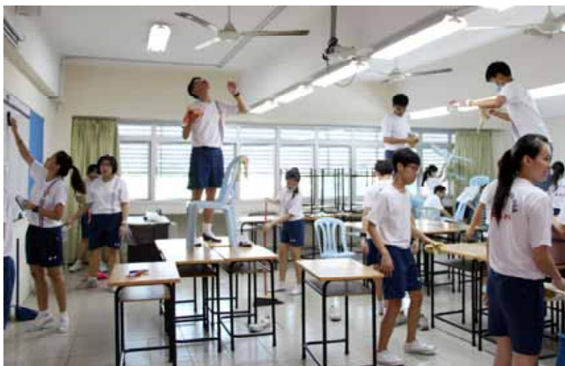
■ 群策群力，打造舒适的读书环境。

早上9时30分，负责老师们带领同学领取打扫所需的用具后，同学便各司其职，开始打扫，有的擦风扇、洗厕所或抹地等。为了让打扫工作顺利的进行，有些同学更主动携带所需的工具到校，如水桶、清洁剂、抹布及海绵等。课室里，卫生股长有组织地以小组的方式分配组员的工作，大大提升工作效率。打扫公共区