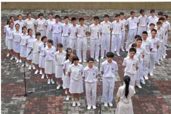
■ 背诵活动可以个人背诵, 也接受团体背诵。图为高一理爱于兴华园背诵古韵文。