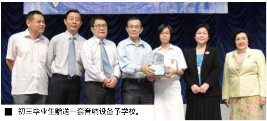
■ 初三毕业生赠送一套音响设备予学校。