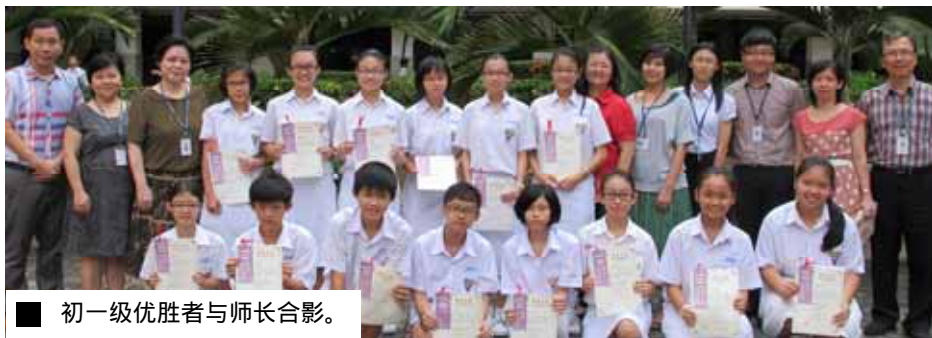
初一级优胜者与师长合影。

令人欣慰的是参与人数逐个阶段增加。第一阶段的作品共收得71份，优胜者26名；第二阶段的作品共收得93份，优胜者28名；第三个阶段的作品共收得119份，优胜者29