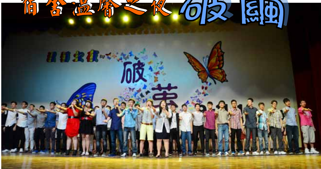
■ 全体高三宿舍生呈献大合唱，感谢师长的谆谆教诲。