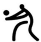
■ 上图: 男生甲组冠军: 高三文商义。 下图: 女生甲组冠军: 高三文商忠。