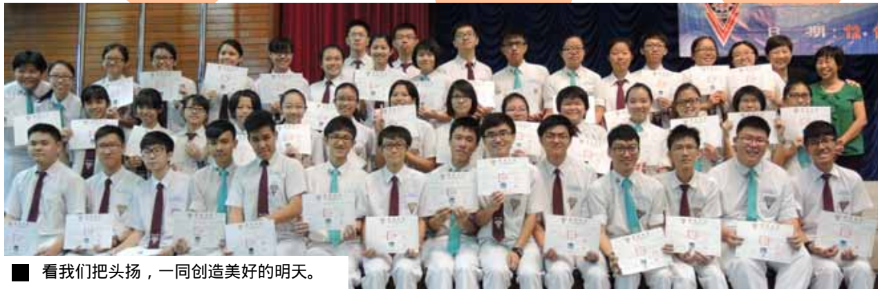
■ 看我们把头扬，一同创造美好的明天。