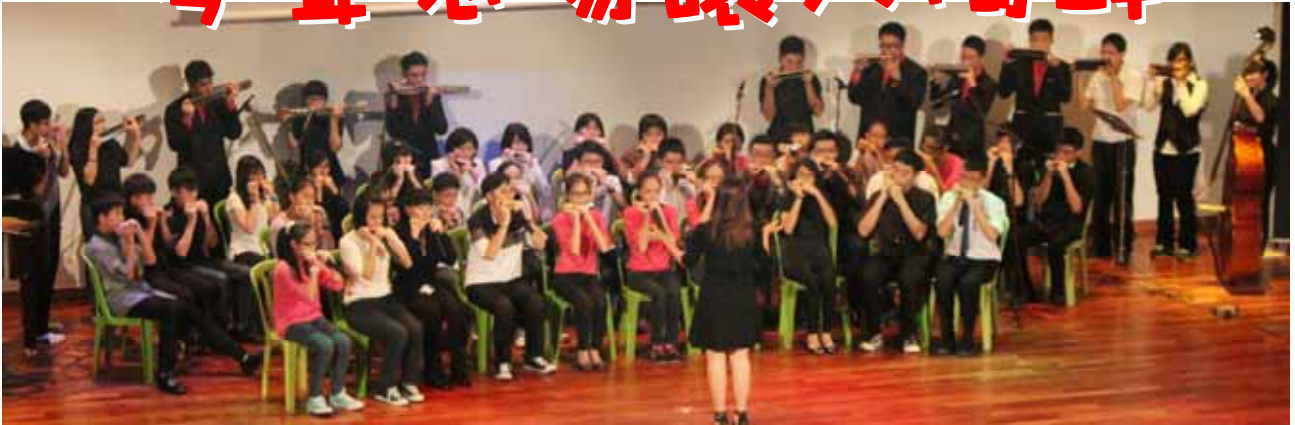
■ 全体表演嘉宾与我校口琴社联合演奏周杰伦的《菊花台》。